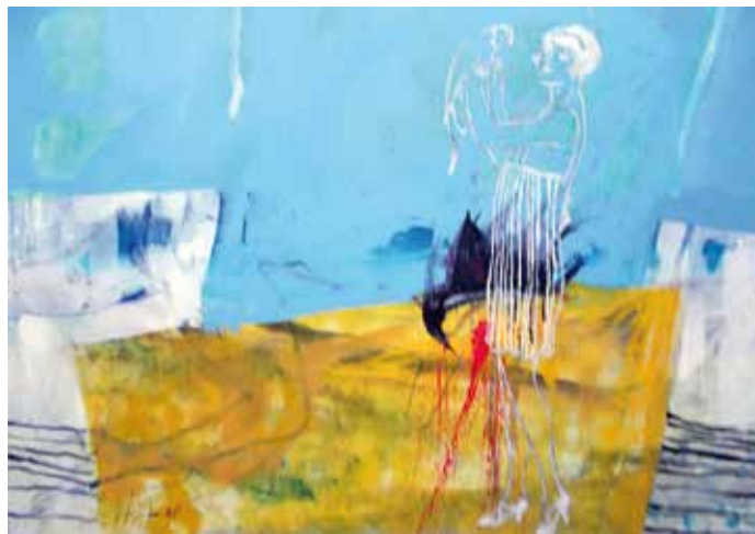
Altar, 2016, Öl