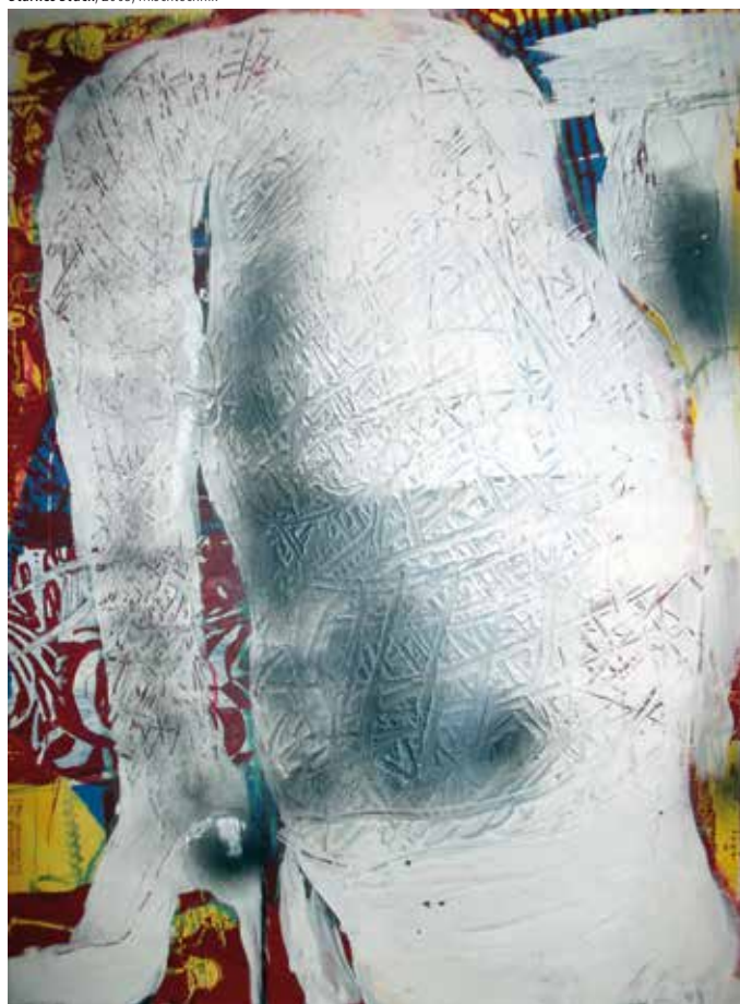
Starkes Stück, 2005, Mischtechnik

Künstlergespräch/Finissage: Freitag 22. März 2019, 15–17 Uhr