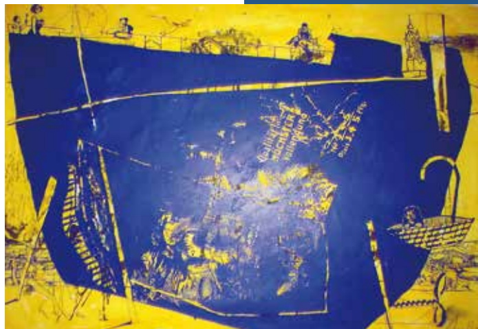
Halle-Arche, 2017, Siebdruck