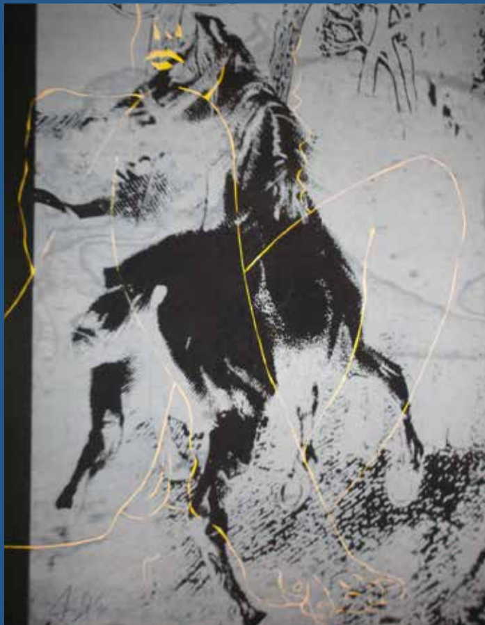
Gaul, 2016, Siebdruck/Linolschnitt

FRISCHE BILDER inspiriert sind die neuen Arbeiten von der Ruhe des Ostseestrandes, abseits von den lästigen alltäglichen Notwendigkeiten. Das Burghard Aust ureigene Fabulieren erscheint gezügelt, Form und Farbe sind minimalisiert und abstrahiert. Figuren wimmeln und krakeelen nicht mehr, der Verzicht auf verwirrende Spannungsbögen formt subtile Landschaften und bannt Momente. Der Künstler umschreibt seine neue poetische Sachlichkeit mit den Worten: „Nichts drauf, und davon viel“. Damit rufen die neuen Arbeiten nach Entschleunigung, nach Kontemplation. Sie sind voller Harmonie, sie sind melancholisch, sie erheben ihre Stimme still.