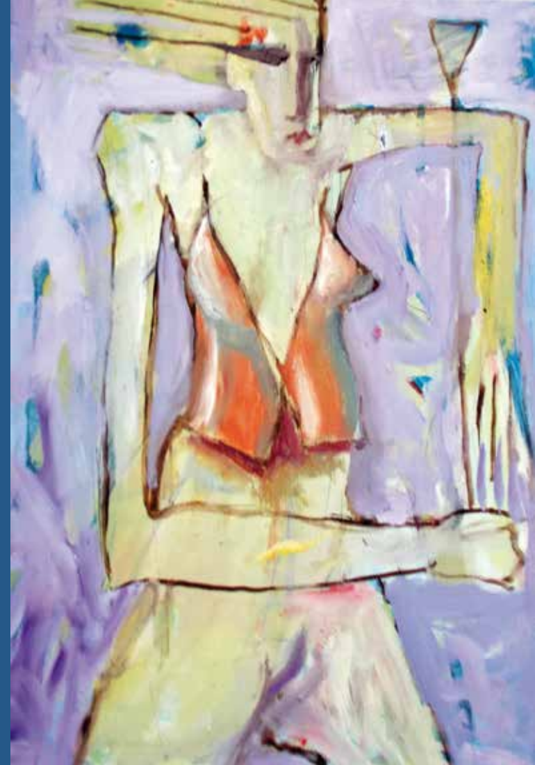
Titel: Mieder, 2017, Mischtechnik