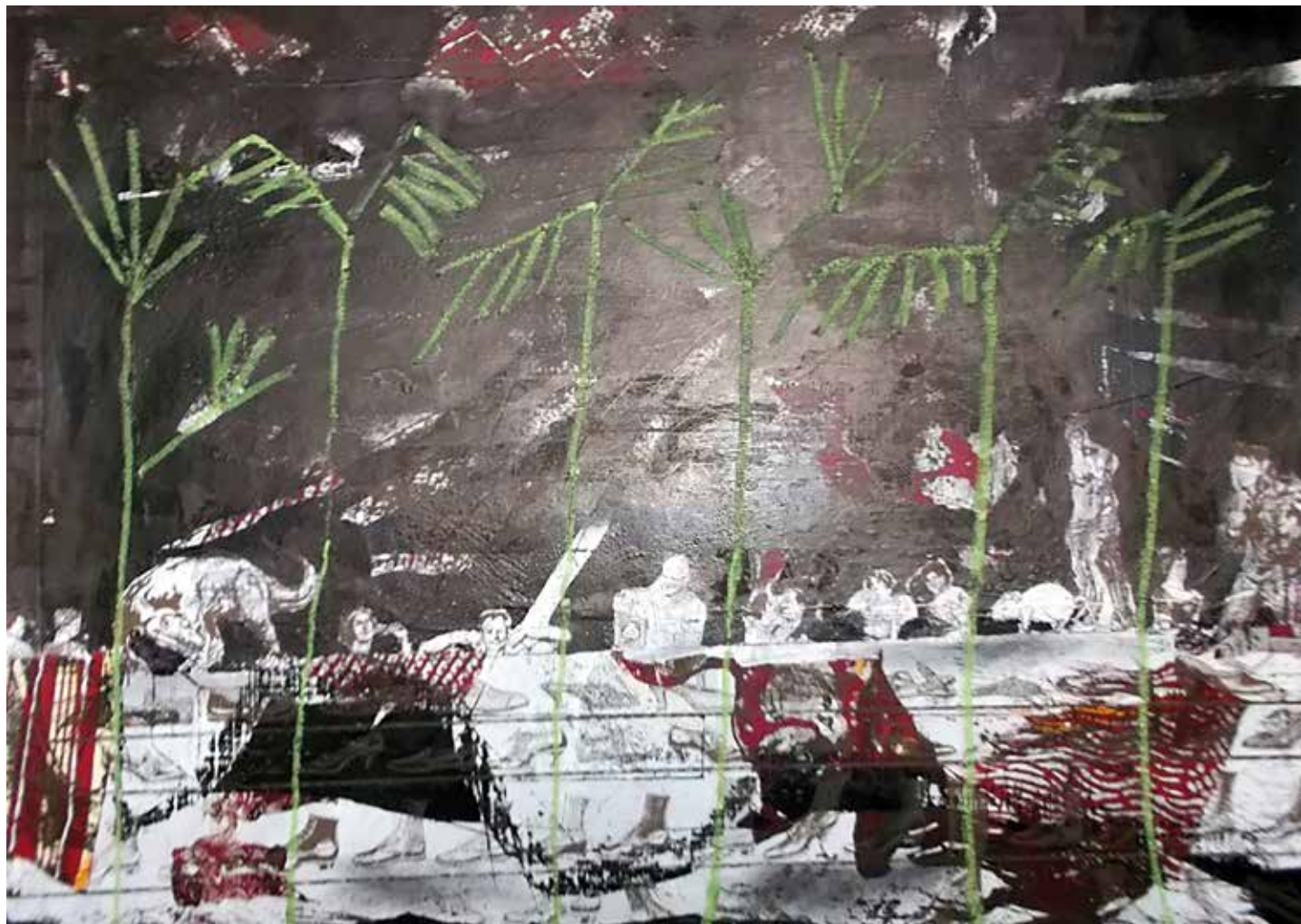
Nachtstück, 2017, Mischtechnik