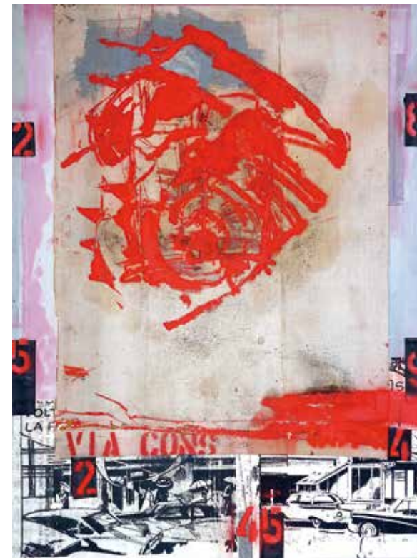
A Continental Journey, Collage, Öl auf Alu-Offset, 103 x 77 cm