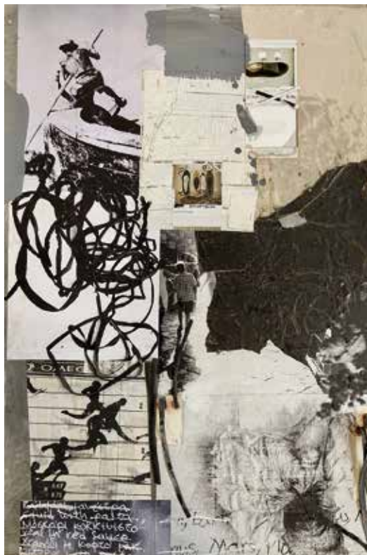
Einerseits – Andererseits, Nov. 2017, Collage, Öl Fundstücke auf Alucobond, 100 x 70 cm