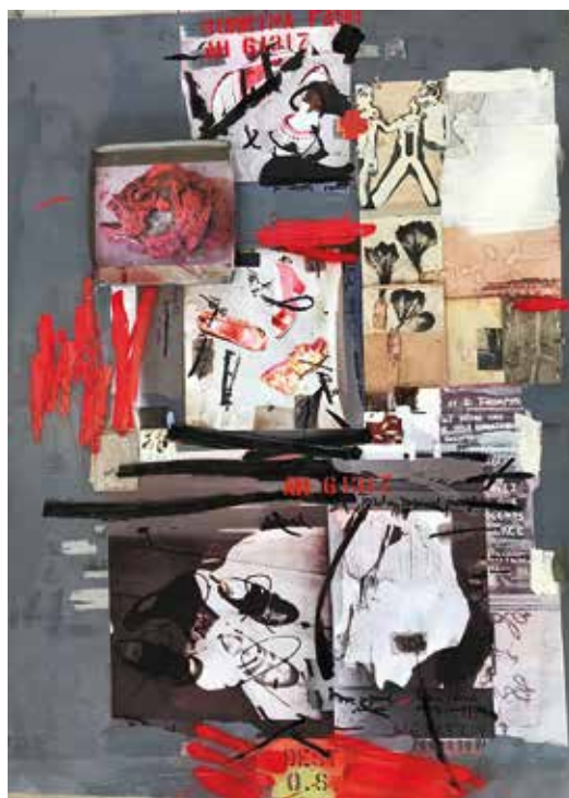
AH 61317, Nov. 2017, Collage, Öl auf Alu-Offset, 205 x 152 cm