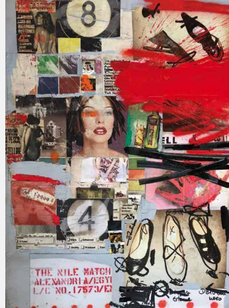
Titel: I never walk alone, Nov. 2017, Collage, Öl auf Alu-Offset, 205 x 152 cm