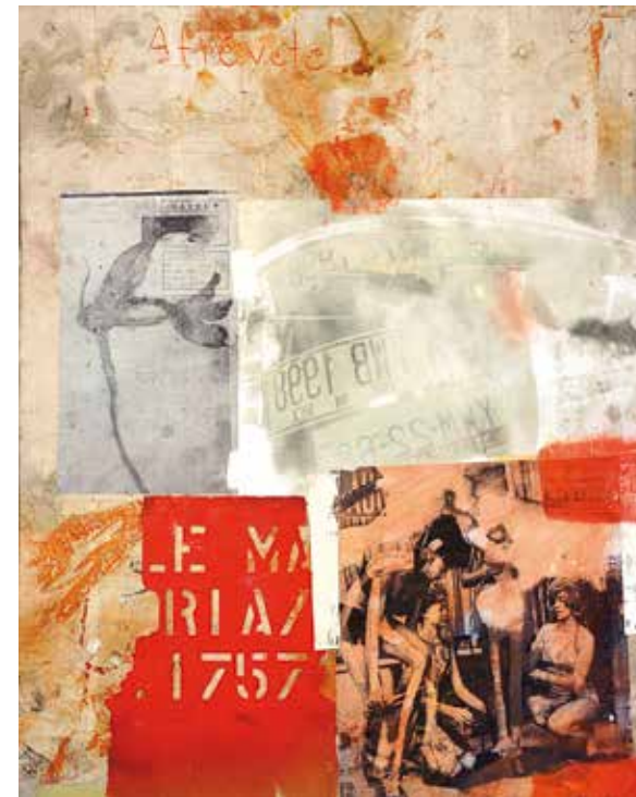
Cut Off, 2012, Collage, Öl auf Alu-Offset, 74,5 x 60 cm