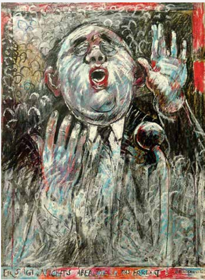
„Er sagte nichts, aber wie er das erklärt!“ (zu Elias Canetti). 1994. Ölpastell. 75 x 55 cm