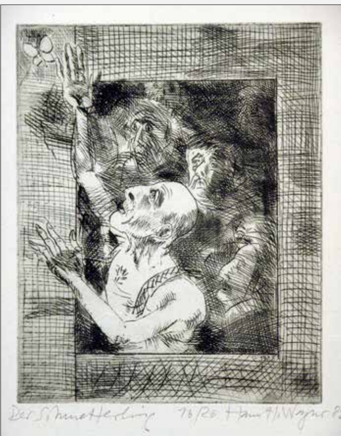
Der Schmetterling. 1982. Radierung. 18,7 x 16 cm

Die Konferenz. 1988. Radierung. 25 x 28 cm