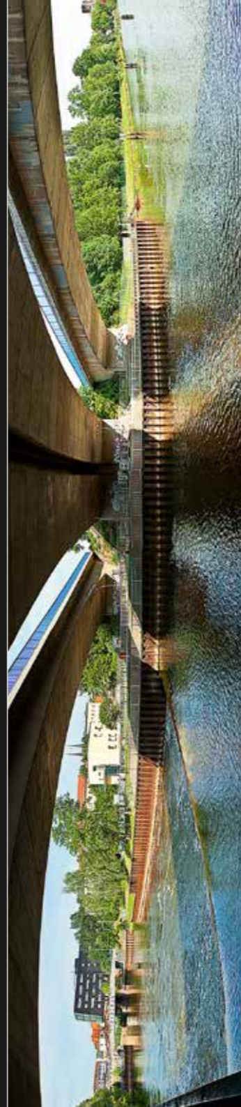
Saale –Panorama. 2012