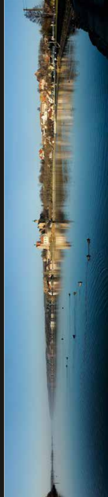
Seeburg –Silber See–Panorama. 2006