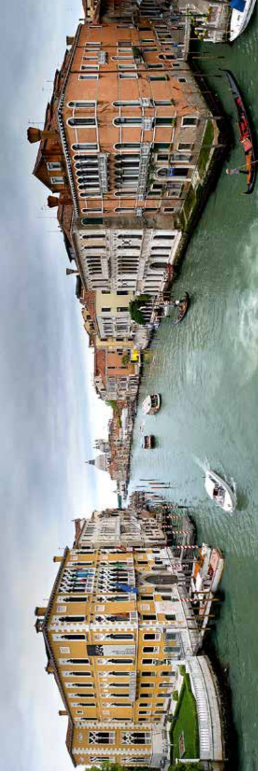
Canal Grande, Ponte dell' Accademia –Panorama. 2009