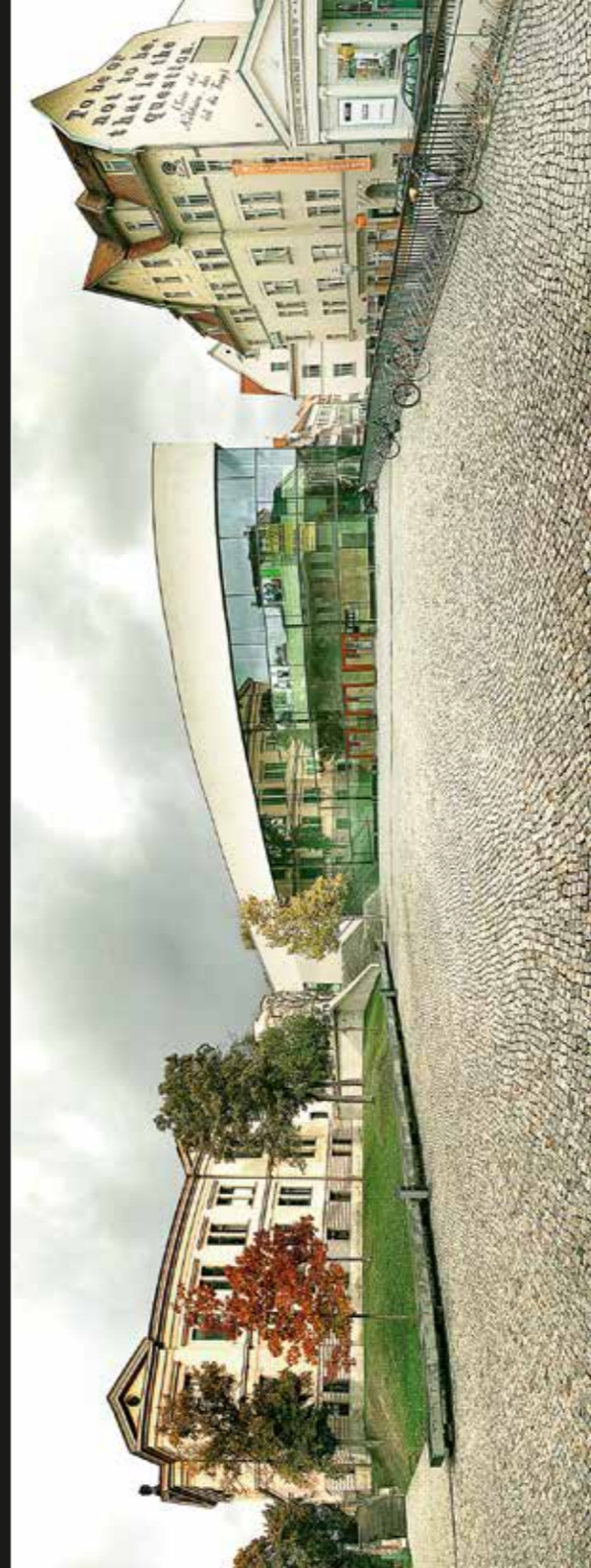
Halle –Campus der Martin-Luther-Universität Halle-Wittenberg –Panorama. 2009