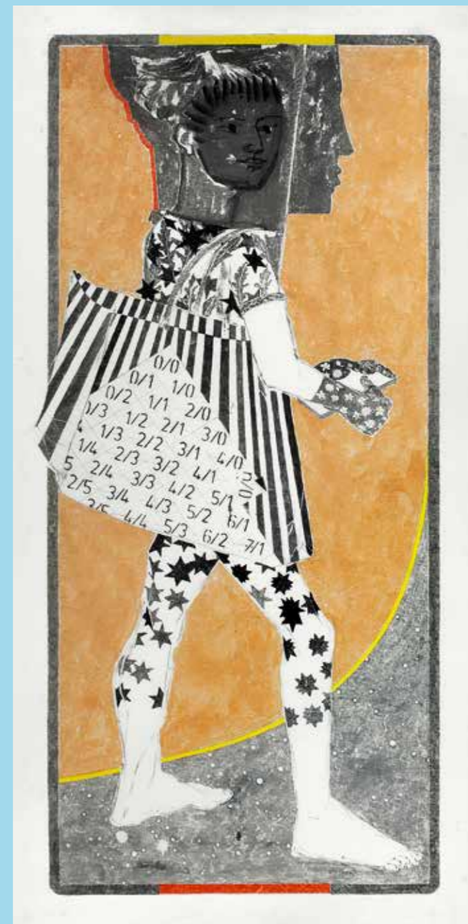
Herakles. Der Gürtel der Amazonen-Königin. 2022. Pigment, Gummi Arabicum, Collage auf Yun-Long-Papier. 30 x 40 cm

Wir tratschen und twittern, soweit die Netze reichen, machen Bilder von uns und der Welt, überweisen Steuern, finden Kochrezepte, melden Brände und wissen auf einen Wischer, wo wir auf der Fahrt von Kairo zum blauen Nil gut essen können. Siri mach die Tür zu! Oh je, die Datenspur, die uns folgt wie die Schleimspur der Nacktschnecke auf dem Plattenweg im Garten. Null oder Eins, ja oder Nein, Top oder Flop, wer bin ich? Die Summe meiner Daten?